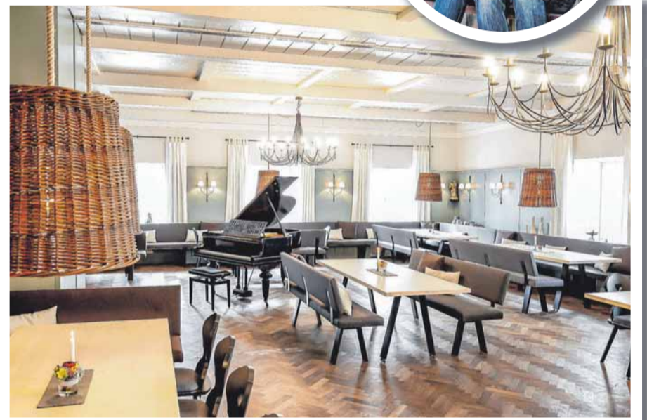
Nicole und Andreas Humburg und das Team heißen Sie herzlich willkommen.